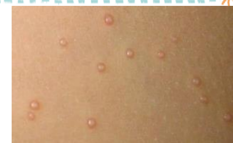
(↑腕にできた水いぼ)

★水いぼは、つぶれて中の液が付くとうつります。 つぶれてじゅくじゅくしている時は、他のお子さんと接触して うつらないようテープ等で保護するか、服で隠れるようにして登園して下さい